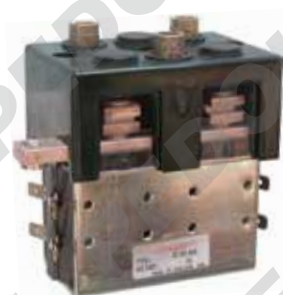
Teleinvertitore monoblocco con contatto in scambio