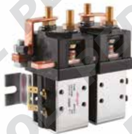
Teleinvertitore con contatto in scambio