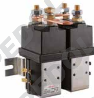
Teleinvertitore con contatto in scambio