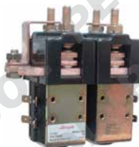
Teleruttore unipolare con contatto in scambio