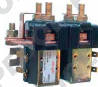
Telerelevatore con contatto in scambio