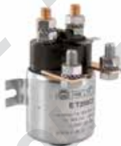
Contatto in scambio