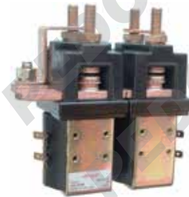
Teleinvertitore con contatto in scambio