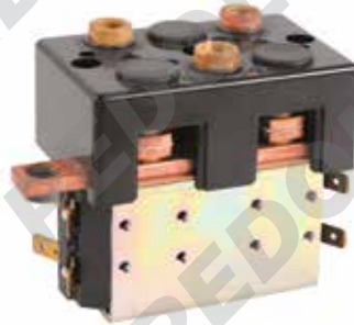
Teleinvertitore monoblocco con contatto in scambio