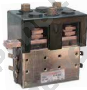
Teleinvertitore monoblocco con contatto in scambio