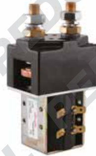
Teleruttore unipolare con contatto in scambio