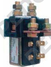
Teleruttore unipolare con contatto in scambio