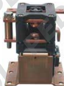
Unipolare - normalmente aperto