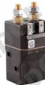
Teleruttore unipolare con contatto in scambio