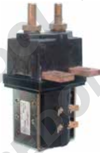
Teleruttore unipolare con contatto in scambio